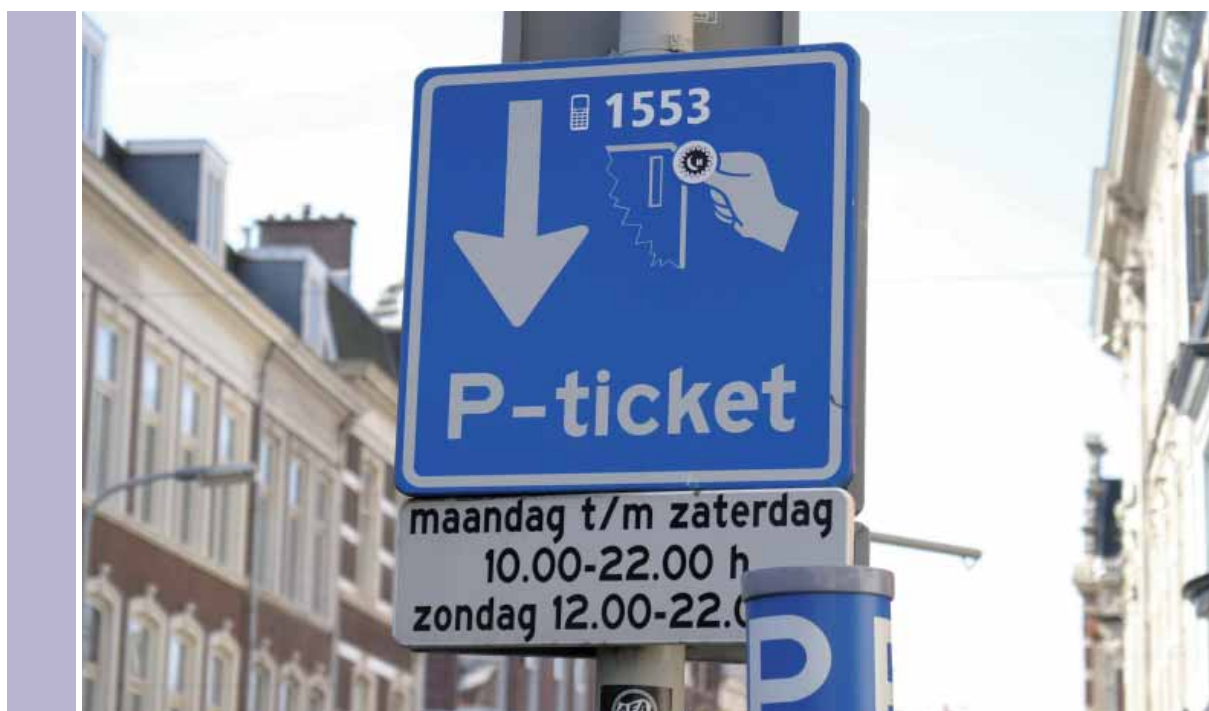
Den Haag Straatparkeren

Het Platform Detailhandel Nederland concludeert dat parkeren wordt gebruikt als melkkoe. Zeker als in ogenschouw wordt genomen dat de Nederlandse gemeenten in 2006, 130 miljoen euro netto hebben overgehouden aan parkeeropbrengsten.