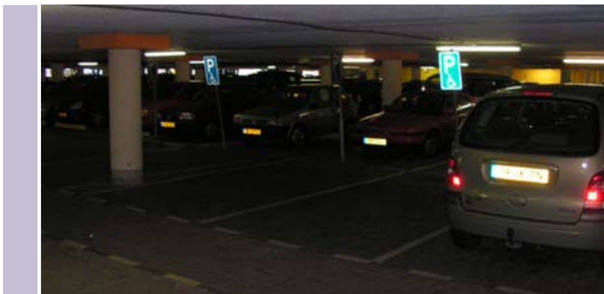
Het Scheepjeshof in Veenendaal is te donker.