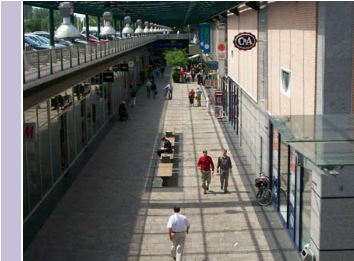
Leidsenhage in Leidschendam, parkeren vlakbij de winkels.

Bij de selectie van de te onderzoeken parkeergelegenheden is bewust gelet op de nabijheid van winkelgebieden. Het wekt daarom geen verbazing dat de bereikbaarheid van de winkels vanaf de parkeerplek bij bijna alle parkeergelegenheden goed is te noemen. Soms hoeft de consument niet eens naar buiten om bij de winkels te komen, zoals in de Grote Markt-garage in Den Haag. Een speciale vermelding verdient de Langstraat in Arnhem. Vanaf de parkeerplek wordt met bordjes aangegeven hoe men bij het centrum komt. In het centrum staat eveneens de richting naar de garage aangegeven, zodat de auto snel kan worden teruggevonden.