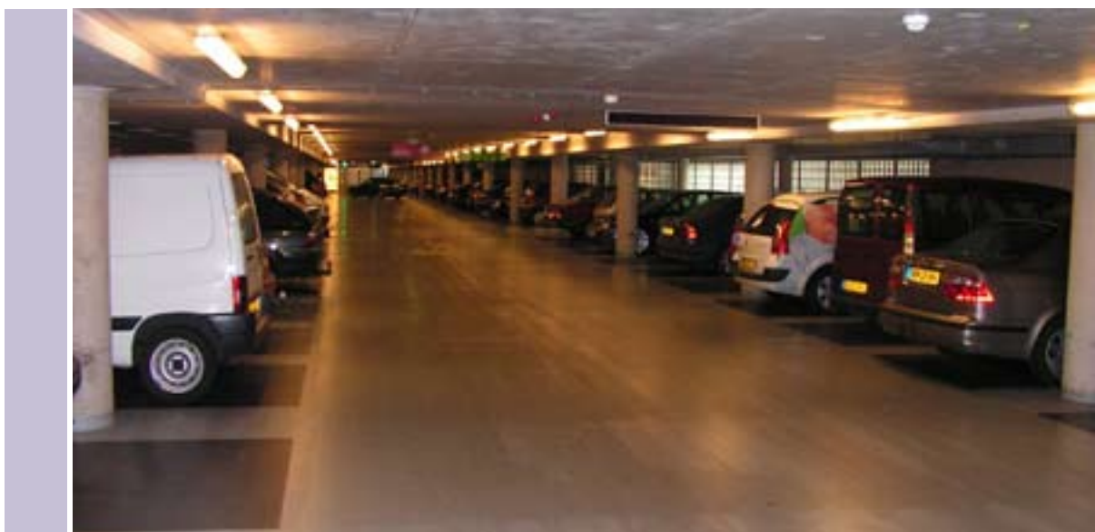
Het Maagjesbolwerk in Zwolle, de beste garage uit de Nationale Parkeertest van vorig jaar.