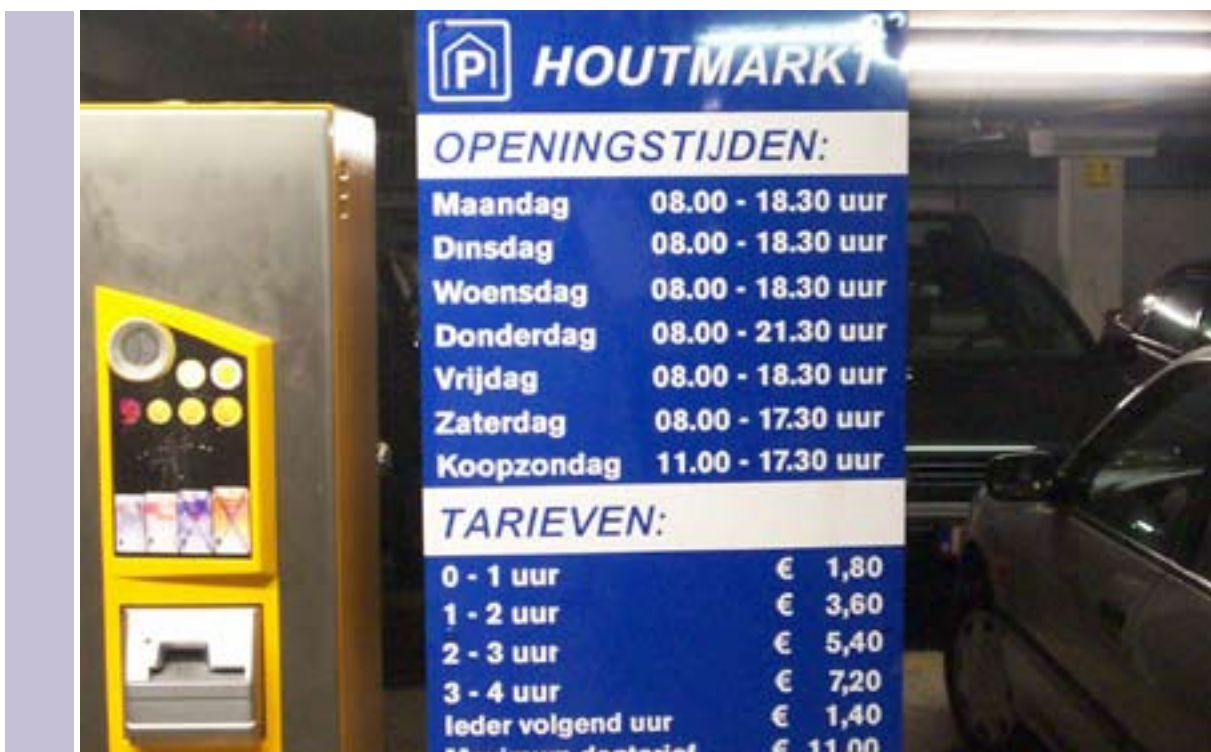
Bij de Houtmarkt-garage in Breda is men na één uur en één minuut € 3,60 kwijt.

In de Nationale Parkeertest 2005 is een aantal van de dit jaar onderzochte parkeergelegenheden ook onderzocht. In Tabel 1 staat bij deze garages tussen haakjes of de tarieven zijn veranderd. Opvallend is dat La Vie in Utrecht de tarieven met 9% heeft verlaagd. Het Platform is van mening dat meer parkeergelegenheden hun prijzen dienen te verlagen. Er zijn 18 garages waar de tarieven zijn gelijk gebleven. Negen garages hebben hun tarieven verhoogd! Wat opvalt is dat het hier om flinke prijsstijgingen gaat van vaak meer dan 10%. Zeker als men weet dat de inflatie in 2005 1,7% bedroeg. Het Platform vindt dat bij hogere prijsstijgingen dan de inflatie het parkeren als melkkoe wordt gebruikt. Dit is het geval bij Villa Arena in Amsterdam (+ 79%) , het Maagjesbolwerk in Zwolle (+ 33%), De Kolk in Amsterdam (+19%), de Koestraat in Amersfoort (+ 14%), de Van Heekgarage in Enschede (+ 13%), de Heuvelgalerij in Eindhoven (+ 12%), Pathé in Groningen (+ 4%), de Stationsstraat in Utrecht (+ 10%) en Beursplein in Rotterdam (+ 4%).