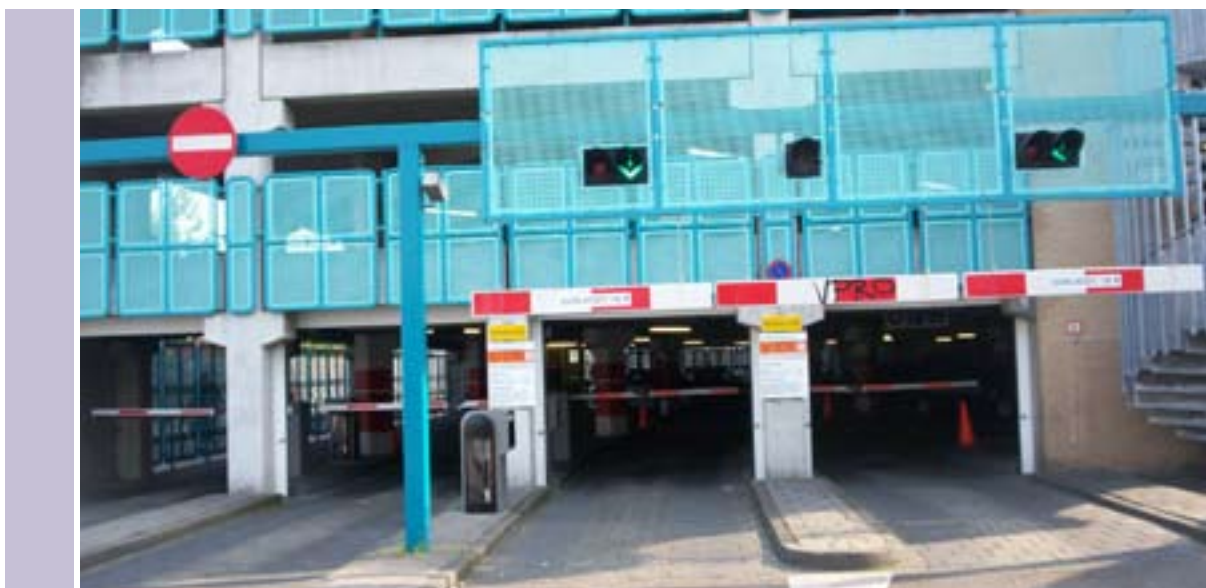
De Scheldeplein-garage in Vlissingen, de garage die het best uit de Nationale Parkeertest 2006 komt.

Opvallend is dat de nummer 2 – de Kousteensedijk in Middelburg – eveneens in de provincie Zeeland is te vinden. De Karperton in Alkmaar maakt de top-3 compleet. De nummer 1 van 2005, het Maagjesbolwerk in Zwolle is nu slechts terug te vinden op plaats 28. Dit is voornamelijk te wijten aan de buitensporige tariefsverhoging met 33% die is doorgevoerd.