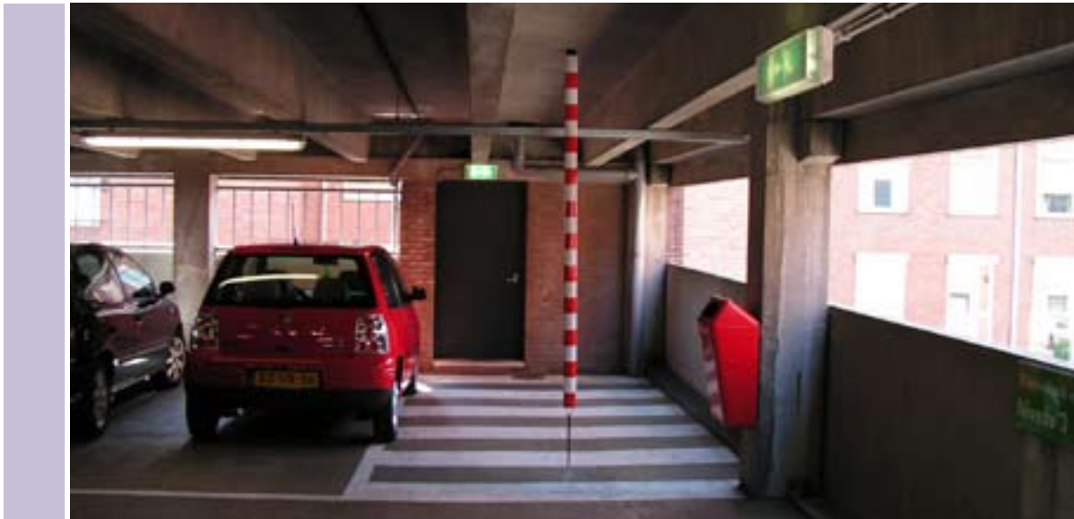
Een duidelijk aangegeven vluchtweg in de Oranjerie in Roermond.