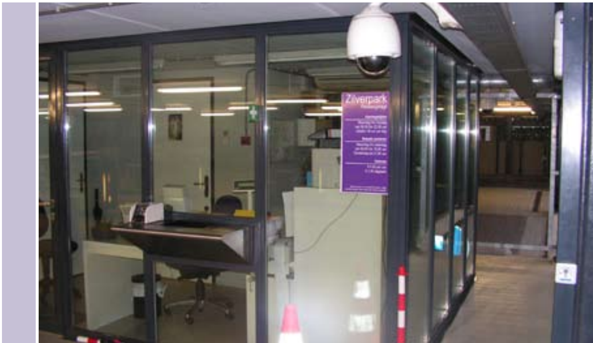
Een goed zichtbaar kantoor en camerabewaking in de Zilverparkgarage in Lelystad.

Van de onderzochte parkeergelegenheden wordt bij 35% de bemanning met matig of slecht beoordeeld. Hier zit niemand bij de in- of uitgang, het personeel heeft geen zicht op de betaalautomaten, er is geen kantoortje in de garage te vinden of er staat niet aangegeven waar het kantoor zich bevindt. Gezien de vaak forse tarieven is dit onbegrijpelijk. Het omgekeerde werd ook vaak aangetroffen. In 35% van de gevallen scoren parkeergelegenheden uitstekend bij dit criterium. Er was vaak ook camerabewaking bij de betaalautomaten, maar was er geen kantoor te vinden (bijvoorbeeld bij de Orlando Passage in Kerkrade). Of er was wel een kantoor, maar onbemand. Belangrijke vragen blijven over. Wanneer komt er hulp bij calamiteiten? Worden de camara-beelden live gevolgd? Het Platform vindt dat bemande parkeergelegenheden de veiligheid bevorderen en dus de voorkeur hebben.