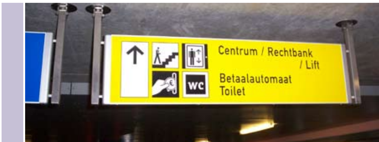
In de Kousteensedijkgarage in Middelburg staat het kernwinkelgebied duidelijk aangegeven.

Bij 12 van de 54 onderzochte parkeergelegenheden kost het een kwartier of langer om vanaf het einde van de snelweg op de plaats van bestemming te komen. Hiervan liggen er drie in Amsterdam en drie in Den Haag. Maar ook in Assen, Breda, Leiden, Utrecht en Vlaardingen kost het veel tijd om een parkeerplek te vinden. De Vrijthof-garage in Maastricht spande dit jaar de kroon met 25 minuten. Dit kwam vooral door de slechte bebording. De Zuidpoort-garage in Delft, De Kaap in Hoogeveen, Leidsenhage in Leidschendam, de Woonboulevard in Utrecht, het Scheldeplein in Vlissingen en de IJsselkade in Zutphen sprongen er positief uit. Vanaf de snelweg is binnen 5 minuten de auto geparkeerd. Het Platform Detailhandel Nederland vindt dat mensen vanaf de snelweg binnen 10 minuten een parkeerplek bij het winkelgebied moeten kunnen vinden. Iets meer dan de helft van de onderzochte parkeergelegenheden voldoet dit jaar aan dat criterium.