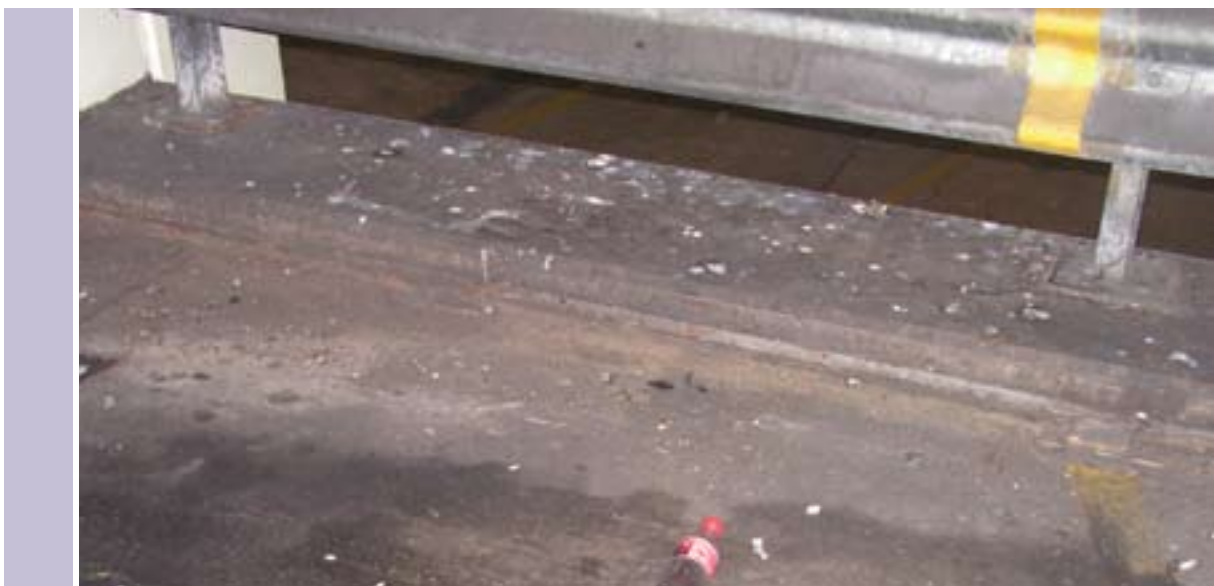
Duivenpoep en zwerfvuil in de garage bij de Dam in Amsterdam.

Bijna 90% van de parkeergarages verdient het predikaat schoon; er ligt nauwelijks zwerfvuil, het ruikt fris en er staan voldoende prullenbakken. Het Gelderlandplein in Amsterdam valt uit de toon door de aanwezigheid van zwerfvuil en de afwezigheid van voldoende prullenbakken. De parkeergarage bij de Dam in dezelfde stad stinkt bovendien. Deze parkeergelegenheid wil men zo snel mogelijk weer verlaten. Bij de Kolk en Villa Arena in Amsterdam en de Aert van der Nesstraat in Rotterdam zijn er onvoldoende prullenbakken. In de Sint Josephstraat in Den Bosch en de Orlando Passage in Kerkrade mag het zwerfvuil beter worden opgeruimd. De garage Bovenlangs in Zoetermeer was dit jaar de enige parkeergelegenheid die stonk naar urine.