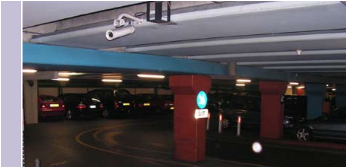
Camerabewaking in Zaailand, Leeuwarden.